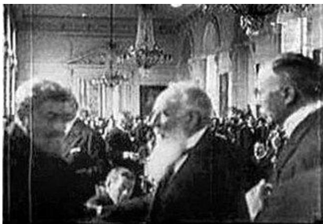
Aponyi Albert a magyar tárgyaló delegáció vezetője

Ugyanezen a napon, tehát 1920. január 15-én a békekonferencia titkársága megkapta a magyar álláspontokat tartalmazó úgynevezett előzetes jegyzékeket. Összesen húsz dokumentumról volt szó, amelyekhez számos statisztikai, térkép- és egyéb melléklet társult. Ezek részletes adatokat tartalmaztak Magyarország földrajzi, gazdasági és kulturális viszonyairól, valamint lakosságának nyelvi megoszlásáról és iskolázottsági mutatóiról. A magyar jegyzékek általában véve a történelmi Magyarország egységének megőrzése mellett érveltek. Egyetlen egy esetben, Erdély hovatarozásának és belső berendezkedésének az ügyében azonban a kompromisszumos lehetőséget is felcsillantották. Az erdélyi kérdéstről címet viselő, VIII. számú jegyzék mondanivalójának lényege Erdély belső viszonyainak svájci mintára történő rendezése, és a terület hovatarozásának újragondolása, illetve az ottani lakosság véleményének a megkérdezése volt.