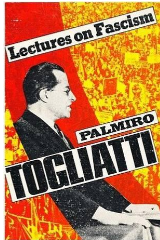
Palmiro Togliatti (1893–1964) – az 1935 elején a faszizmusról tartott előadásai az 1980-as években számos nyelven megjelentek

viszonyok („a forradalom erőinek növekedése” – jelzi az előző bekezdés – Sz.G.) közepette az uralmon levő burzsoázia, mindinkább a faszizmusban keres menedéket, a fináncsőke legreakciósabb, legsovinisztább és leginkább imperialista elemeinek nyílt terrorista diktatúrájának létrehozásában, abból a célból, hogy a dolgozók kirablására kivételes rendszabályokat valósítson meg, előkészítse az imperialista háborút, a Szovjetunió megtámadását, Kína leigázását és felosztását, és mindezek segítségével megakadályozzák a forradalmat.” 27