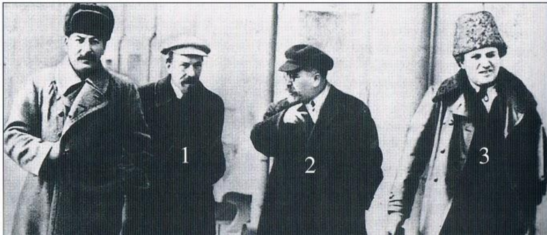
Sztálin, három áldozatával: Alekszej Rikov (1881–1938) agrárszakértő, a NEP támogatója, Lev Kamenyev (1883–1936), Grigorij Zinovjev (1883–1936)

hangsúlyos felismerése, hogy a fasizmus sajátos uralmi forma. „Mit jelentenek az olaszországi események? Vajon nem mértek-e hallatlan csapást a polgári demokráciára? Nem volt-e Olaszország a polgári demokráciával leginkább megáldott országok egyike? A fasiszta támadás nem csupán a monarchista eszmékre, hanem a polgári demokrácia eszméire mért csapás is volt.” 10 A beszámoló e része bemutatta a fasizmus értékelések egyik legfontosabb következtetését: egyrészt, hogy a kapitalizmus politikai rendszerei közül a fasizmus a legagresszívebb, másrészt nem csupán a munkásmozgalom ellen irányul, hanem a polgári demokrácia ellen is. Ezt követően a kongresszus vitájában megjelenik az a két lehetőség, amely a fasizmus elleni összefogás alapja, illetve egyik magasabb formája lehet: a két munkáspárt szervezeti együttműködésén alapuló egységfront, illetve az ennél is szélesebb összefogást, a munkáskormány alakítása. „Ha van ország, ahol ezzel a jelszóval maximális eredményt lehet elérni, akkor ez az ország Olaszország.” 11