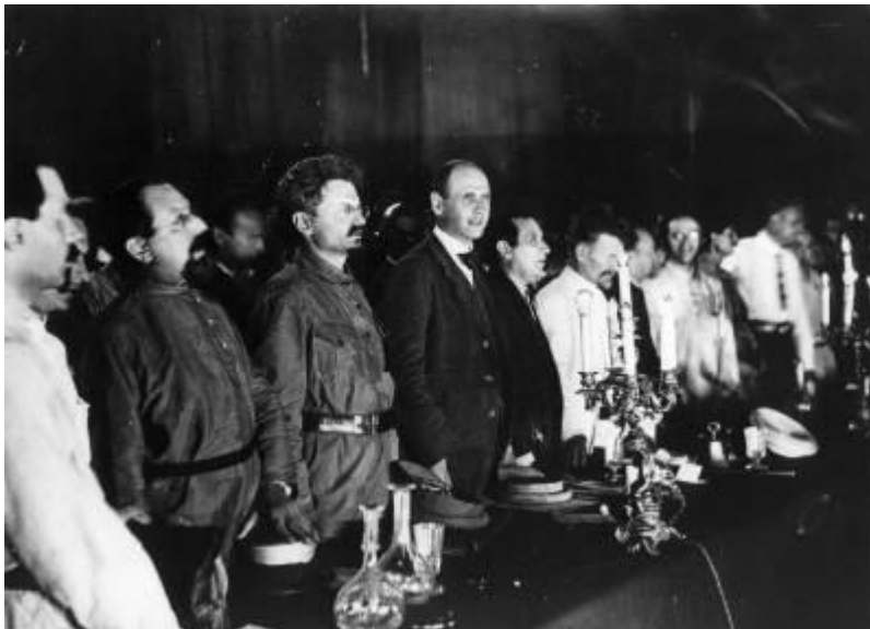
1920. A Komintern II. kongresszusána megnyitóján – jobbról a harmadik Trockij (1879–1940), Zinovjev az ötödik, a nyolcadik, szemüveges Karl Radek

A faszizmus vita már Mussolini hatalomra jutása előtt elkezdődött, annak a döbbenetnek a hatására, amit az váltott ki, hogy a munkásmozgalom tömegakcióival szemben a falvakban és a városokban is jelentős létszámú és befolyású ellenséges csoportok, majd mind nagyobb tömegek jelentek meg. Ez szokatlan volt. A teoretizálásra nem ritkán túlságosan is hajlamos munkásmozgalomban szinte azonnal megkezdték a jelenség elemzését; nem utolsó sorban a fasiszták elleni mindennapi gyakorlati lépések kimunkálása érdekében.