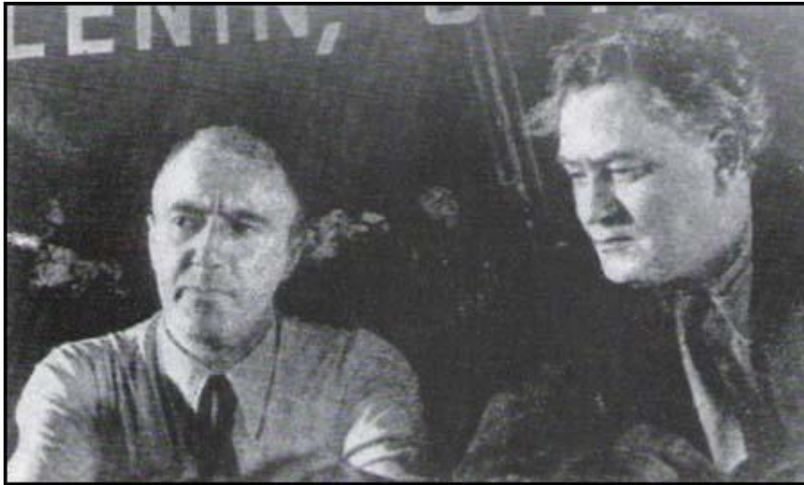
Georgi Dimitrov (1882–1949) és a brit KP főtítkára, Harry Pollit (1890–1960) a Komintern VII. kongresszusán, 1935

A Komintern – és a Szovjetunió – számára a fő veszély persze Hitler volt. E közvetlen fenyegetettség eredményezte a népfront politikát, amelynek alapját a faszizmus „dimitrovi” meghatározása foglalta össze.