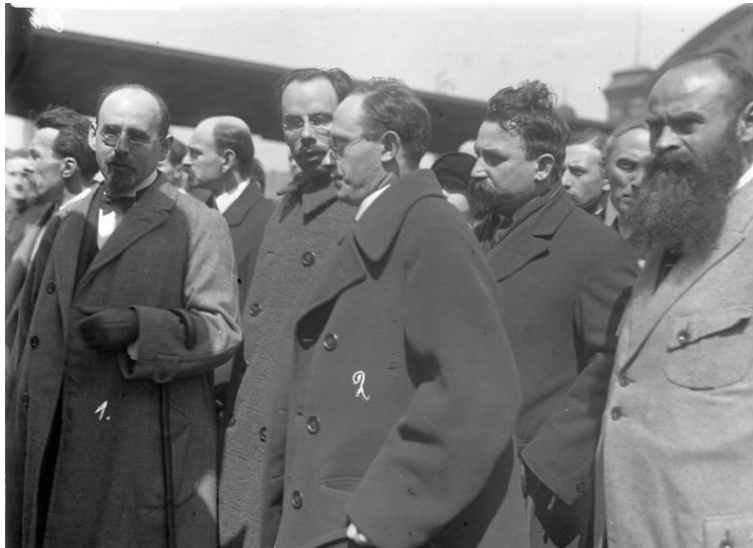
I. Februar 1932

A vitában a munkáskormány, vagyis a minden korábbinál szélesebb összefogás szükségessége mellett érvelő a munkásmozgalmat ért vereség súlyosságára, illetve a faszizmus további terjedésének veszélyeire hívták fel a figyelmet. Így Karl Radek, aki a Kominterben az irányvonalat támogató Nyikolaj Buharin legközelebbi munkatársa volt, magyar vonatkozást is érintve figyelmeztetett: „A faszizmus győzelmében nem csupán a fasiszták győzelmének mechanikus győzelmét látom, hanem egyben a szocializmusnak és a kommunizmusnak a világforradalmi periódus kezdete óta elszenvedett legsúlyosabb vereségét is, súlyosabb vereséget, mint Tanács Magyarország esetében, mivel a faszizmus győzelme, az olasz szocializmus és az egész olasz munkásmozgalmak pillanatnyi eszmei és politikai csődjének következménye.” 13 Radek már azzal is jelezte az egységfront, illetve a munkáskormány melletti véleményét, hogy nem tett különbséget a felelősség, a vereség vitában a szocialista és a kommunista párt között. S talán még egy fontos megjegyzés Radektől: a faszizmus hatalomra jutását az olasz társadalom egyes rétegei – munkásosztály, kispolgárság – válsága mellett a burzsoázia válságára is visszavezette, amely az állam válságához vezetett, s a megoldás a liberális irányzat vereségét jelentette.