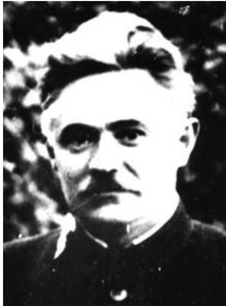
Dmitrij Manuilovics (1883-1959) – Sztálin keze a Kominternben

Komintern VII. Kongresszusán elmondott, A fasizmus támadás és a Kommunista Internacionálé feladatai a munkásosztály egységéért, a fasizmus ellen folytatott harcban meglehetősen hosszú című és nem kevésbé terjedelmes előadói beszédének sorait, akkor a következőket találjuk: „A hatalmon levő fasizmus, elvtársak, mint ahogyan a Kommunista Internacionálé Végrehajtó Bizottságának XIII. Plénuma helyesen jellemezte, a fináncsőke legreakciósabb, legsovinisztább, legimperialistább elemeinek nyílt, terrorista diktatúrája.” 24 Vagyis maga Dimitrov, ekkor már a Komintern főtitkára 25 utal arra, hogy a definíció korábban született.