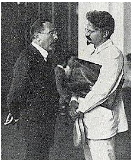
Ritka fénykép: G.M. Serrati (1874–1926) és Leo Trockij Moszkvában a Komintern kongresszusán

A faszizmus gyors térnyerése egyben látványos is volt. Az olasz munkásság 1920-as sikertelen gyárfoglaló mozgalmát követő politikai és mélyülő gazdasági válságban előbb a földfogaló parasztok ellen vonuló „harci osztágaival” tűnt ki, majd megjelent a városokban is. Az olasz munkássajtó, a Milánóban megjelenő szocialista Avanti! (Előre!), és a Rómában kiadott, országos terjesztésű Il Comunista egyaránt cikkezett a fasisztákról, és szükségesnek tartotta a fellépést, a szocialisták a „párt hagyományainak megfelelő módszereket”, a kommunisták akár a fegyvereset is. Azonban egyikük sem tartotta olyan fenyegetésnek, amely komoly fenyegetést jelenthet a munkásmozgalom számára, bár érzékelték a veszély fokozódását. A számszerűsíthető erőviszonyok 1921 elején a következők voltak: a szocialisták taglétszáma 112.000 volt, és 123 mandátummal rendelkeztek a parlamentben, a kommunistáké 58.000 volt és 15 mandátum, a fasiszták 100.000 tagot regisztráltak, valamint 35 képviselőjük volt. 3