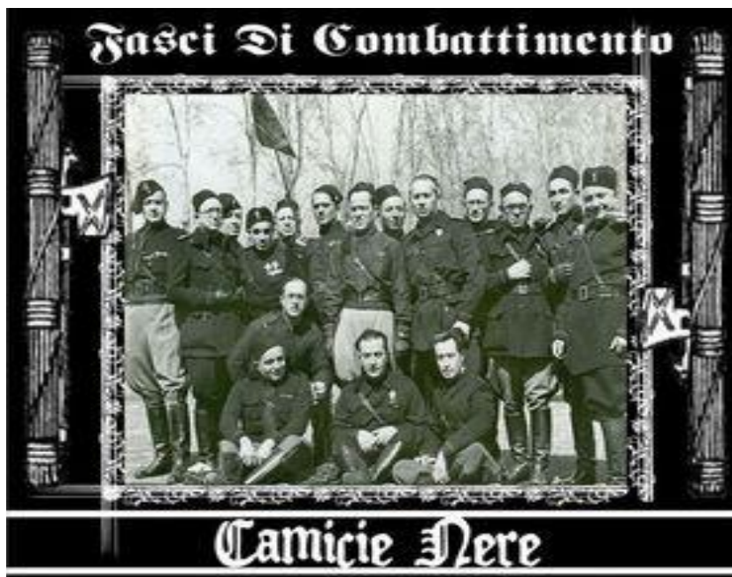
A „fekete ingesek“...

A faszizmus vita már Mussolini hatalomra jutása előtt elkezdődött, annak a döbbenetnek a hatására, amit az váltott ki, hogy a munkásmozgalom tömegakcióival szemben a falvakban és a városokban is jelentős létszámú és befolyású ellenséges csoportok, majd mind nagyobb tömegek jelentek meg. Ez szokatlan volt. A teoretizálásra nem ritkán túlságosan is hajlamos munkásmozgalomban szinte azonnal megkezdték a jelenség elemzését; nem utolsó sorban a fasiszták elleni mindennapi gyakorlati lépések kimunkálása érdekében.