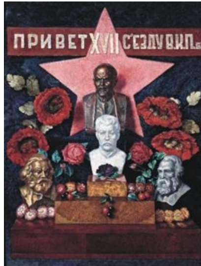
Ilya Mashkov. Regards to the XVII Congress of the All-Union Bolshevik Communist Party 1934, Oil on canvas; 131,5 x 100 cm. Volgograd Museum of Fine Arts

Ugyanakkor óvatosan fogalmazott a „győztesek kongresszusán”, még 1934 januárjában: „Egyes német politikusok ezzel kapcsolatban (ti. a szovjet külpolitikáról – Sz.G.), hogy a Szovjetunió most Franciaország és Lengyelország felé fordul, hogy a versailles-i szerződés ellenségéből annak pártolójává vált, hogy ennek a változásnak a magyarázata a fasizmus hatalomra jutása Németországban. Ez nem igaz. Természetesen távol áll tőlünk, hogy csodáljuk a németországi fasiszta rezsimet. De most nem a fasizmusról van szó, akkor sem, ha a fasizmus, például Olaszországban, nem gátolta, hogy a Szovjetunió a lehető legjobb kapcsolatokat alakítsa ki ezzel az országgal. Hasonlóképpen nincs szó álláspontunk megváltozásáról a versailles-i szerződéssel kapcsolatban. Mi, akik a breszti béke szégyenét megéltük, nem dicsőíthetjük a versailles-i szerződést. Mi csupán azzal nem értünk egyet, hogy a világot e miatt a szerződés miatt egy újabb háború örvényébe döntsék. Mi nem tájékoztunk Németország felé, mint ahogyan nem tájékoztunk Lengyelország és Franciaország felé sem. Mi a múltban, akárcsak a jelenben a Szovjetunióra orientálódunk, csakis a Szovjetunióra. (Tapsvihar.) És ha a Szovjetunió érdekei megkívánják a közeledést az egyik vagy a másik, a béke megbontásában nem érdekelt országhoz, akkor mi habozás nélkül készek vagyunk erre.” 29 A nyitás a „Nyugat” felé egyértelmű volt az ezzel egyet nem értők számára is.