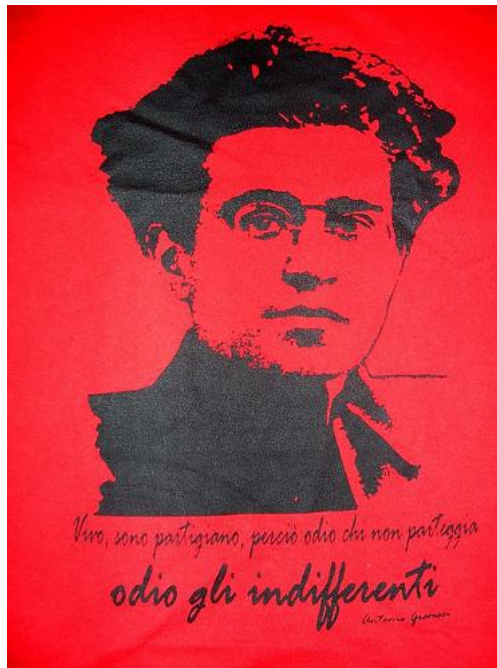
Antinio Gramsci (1891–1937) – utálta a közömböseket