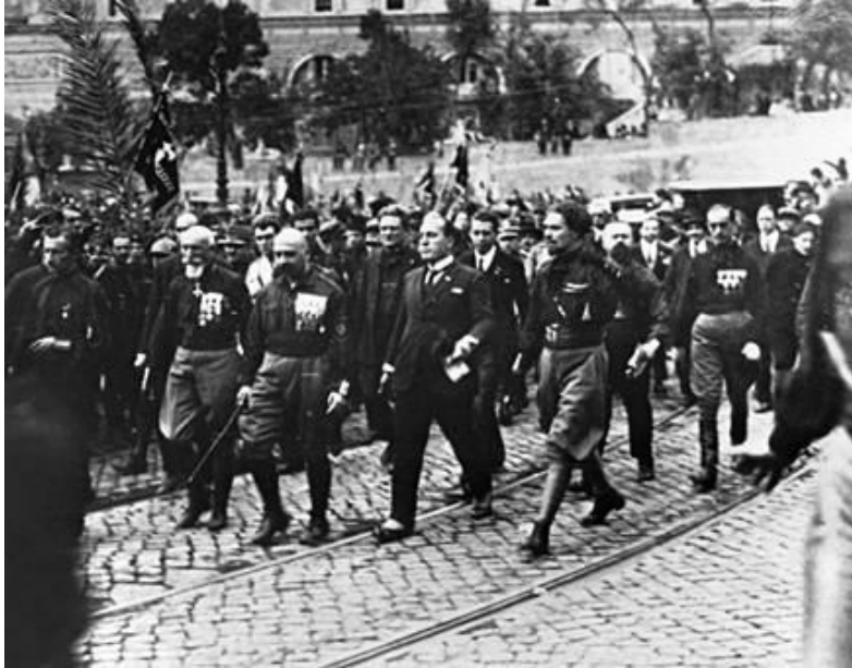
A marcia su Roma

kommunisták elutasítottak. A kommunisták közös akciók szervezésére tettek javaslatot a tőke támadása ellen, amibe végül a reformisták is egy májusi nemzetközi akció erejéig beleegyeztek. Az olasz fasizmus szóba került a megbeszéléseken, de nem kezelték külön – a tőke támadása egyik jelenségének tartották Olaszországban. 6