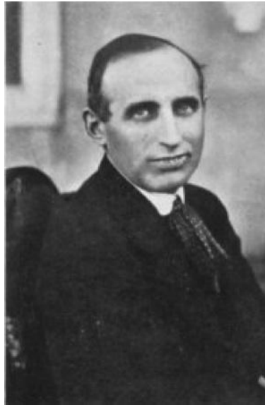
Varga Jenő (1879–1964) – közgazdász, 1921–1927-ben a berlini Információs és Statisztikai Intézet vezetője, a moszkvai Világgazdasági- és Politikai Intézet létrehozója és vezetője

A Komintern és Mussolini mozgalma egyszerre indult, 1919 márciusában. Míg az előbbi széles nemzetközi visszhangot váltott ki, az utóbbinak alig volt hírértéke. Egy év múlva azonban már fel kellett ismerniük a Komintern vezetőknek a fasizmusban rejlő fenyegetést. Az elnök, Grigorij Zinovjev a Komintern folyóiratában megjelentetett nyílt levelében figyelmeztette az olasz baloldal legnagyobb támogatottságot élvező vezetőjét, Giacinto Menotti Serrait, hogy Olaszországban „teljes mértékben lehetséges egy dühödő burzsoá reakció ideiglenes győzelme.” 2